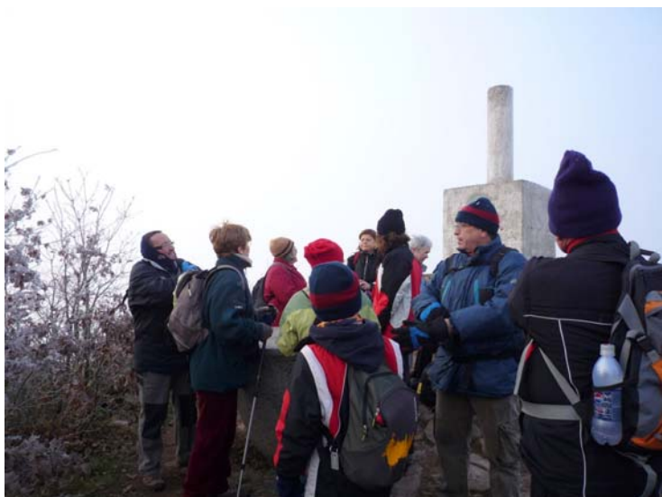
Tossal de la Baltasana

Després de passar una bona estona a aquestes típiques coves del Prades, baixem cap a Prades on encara podem veure el final del partit del Barça. Felicitats als aficionats "cules" i us desitgem BONES FESTES a TOTS.