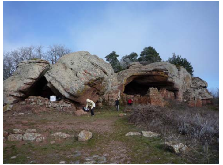
Coves del Pere