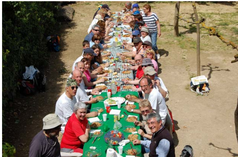
Ermita de Sant Antoni – Ulldemolins