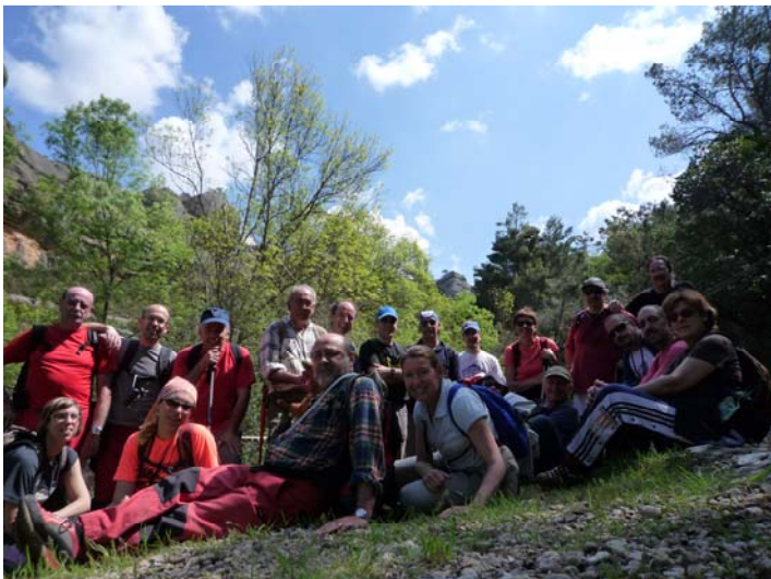
Pont de Sant Bartomeu