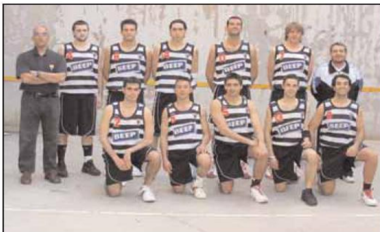
Sènior masculí 04/05

tes commemoratius, que lluiran al setembre amb la presentació del llibre sobre la història del bàsquet a l'entitat. Per l'octubre es farà una extraordinària exposició filatèlica amb la col·lecció de segells, de temàtica de bàsquet, d'un històric del bàsquet reusenc i català, en Pere Magrané, la col·lecció del qual està considerada com una de les dues millors del món de l'especialitat. L'exposició es farà al Palau Bofarull, antic local social del Reus Ploms.