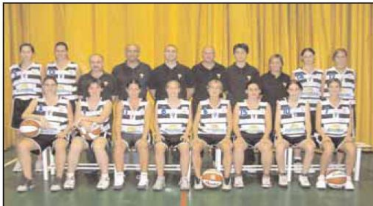
Sènior femení 04/05 a Copa Catalunya

En dues temporades havien aconseguit dos ascensos consecutius i això va fer que els responsables assentessin millor l'estructura del bàsquet i del femení en particular. Al 1986 les noies queden 3es del campionat espanyol de 2 a Divisió i les Júniors es proclamen campiones de Catalunya. En aquest 1986 esdevé un aconeixement important per l'entitat i pel