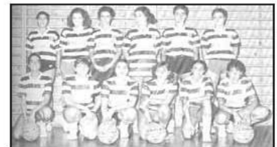
Sènior femení temporada 87/88

Al 1957 s'inaugura un nou Pavelló, dedicat primerament a la gimnàstica i que posseïa també una petita piscina interior per entrenament. Aviat s'acondicionà el gimnàs per la pràctica del bàsquet i el 26 de gener de 1958 la Secció de Bàsquet va reinagurar el recinte amb tres encontres, un de veterans entre Reus i Tarragona, un de femení entre el Picadero i el Laietà, i un de nois entre el Sitges i el C.N. Reus Ploms i al març d'aquest 58 es va organitzar un partit entre un combinat de