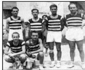
Campions de Catalunya de 3a, 43/44