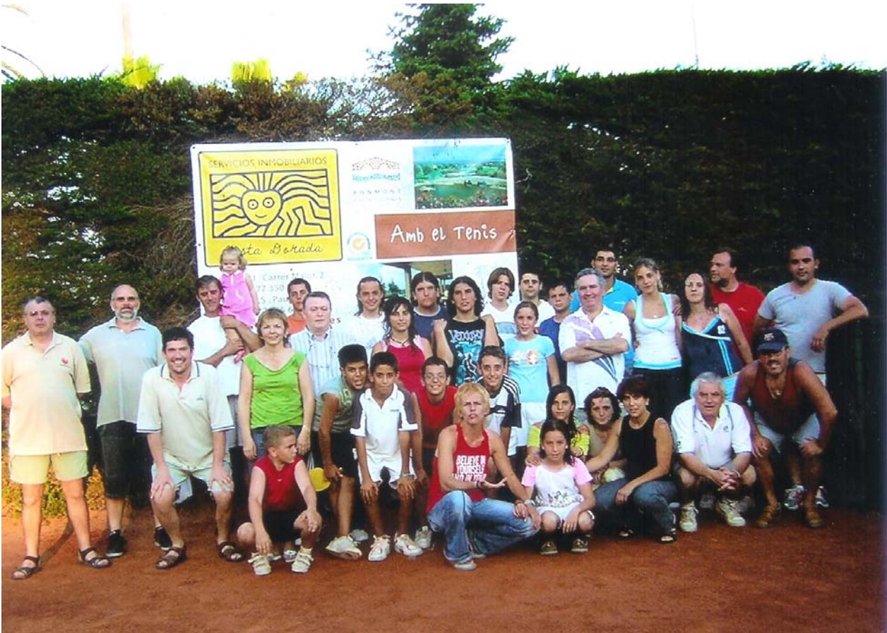
CAMPIONATS (Millors resultats)